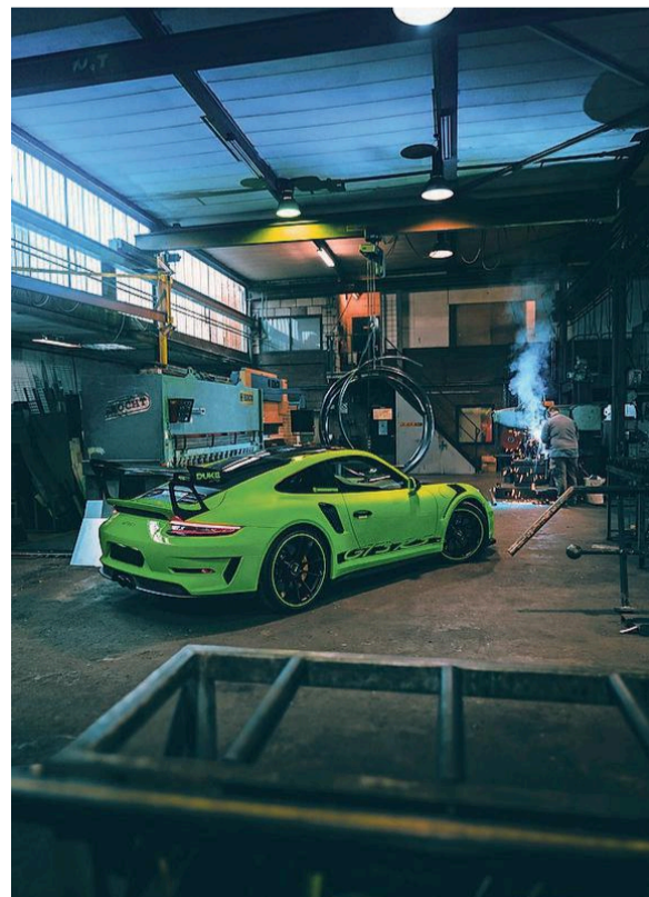
ELIN DE WILDE, UITHOORN